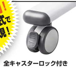
全キャスターロック付き