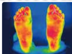
天空を1時間履いた後

地方独立行政法人 大阪産業技術研究所 に於いての サーモグラフィ試験 〈被験者：二十代女性〉