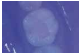
高出力重合器 X ライト 1500mW モードで5秒照射