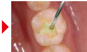
フロアブルレジン/ペーストレジン充填・光重合