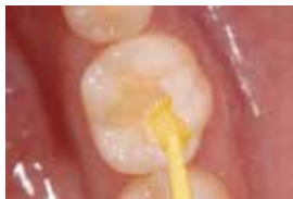
窩洞形成後セブンボンドを10秒間塗布