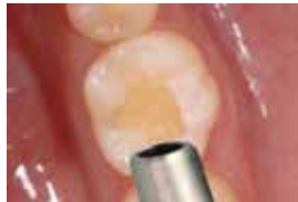
弱いエアードで液が動かなくなるまで約5秒間乾燥