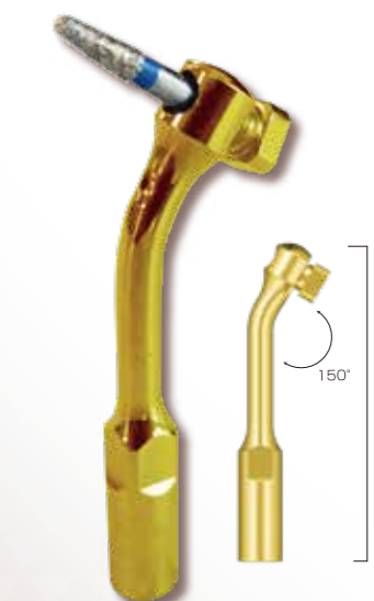
※画像はバー取付イメージです。バーは付属しません。