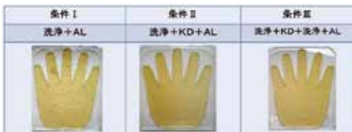
※AL(アルコール3ml)KD(ケロデックス1g)/条件:3日制菌効果の観察

■アルコール消毒液との併用時 有効性の評価試験 消毒による制菌効果を抑制することなく、アルコールによる肌荒れ抑制効果として使用することが実証されました。